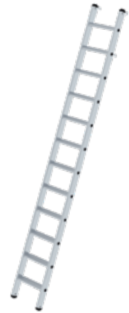
Abb. Bestell-Nr. 41312