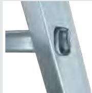
4-fach gebördelte Stufen-/ Holmverbindung